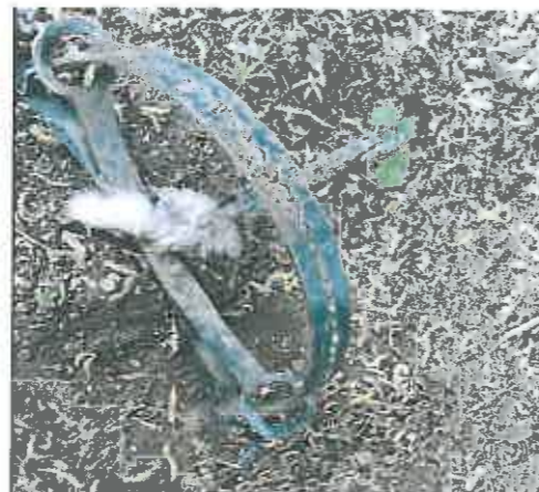
A hattyúnyak-csapda összezárt állapotban.