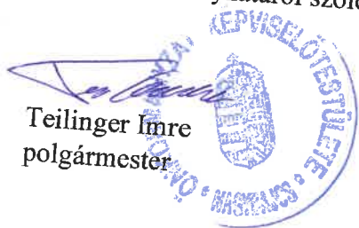
Teilinger Imre polgármester

(2) Hatályát veszti Nagybajcs Község Önkormányzata Képviselő-testületének Szervezeti és Működési Szabályzatáról szóló 12/2014. (XI.24) önkormányzati rendelete.